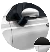
0Q1/738 Grigio Argento / Tetto Nero