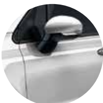
5DN/348 Grigio Argento