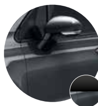
5CL/170 Grigio Moda / Tetto Nero