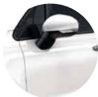
5CA/296 Bianco Gelato