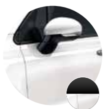
0PY/317 Bianco Gelato / Tetto Nero