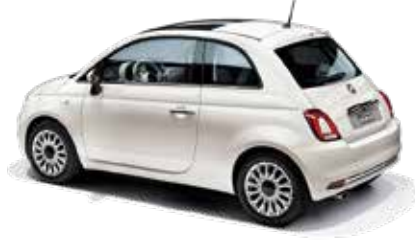
BIANCO GELATO - 5CA/268