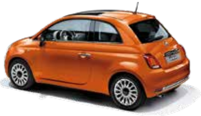
ARANCIA SICILIA - 5CK/562