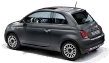
GRIGIO POMPEI - 5DP/695