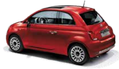
ROSSO PASSIONE - 5CJ/111