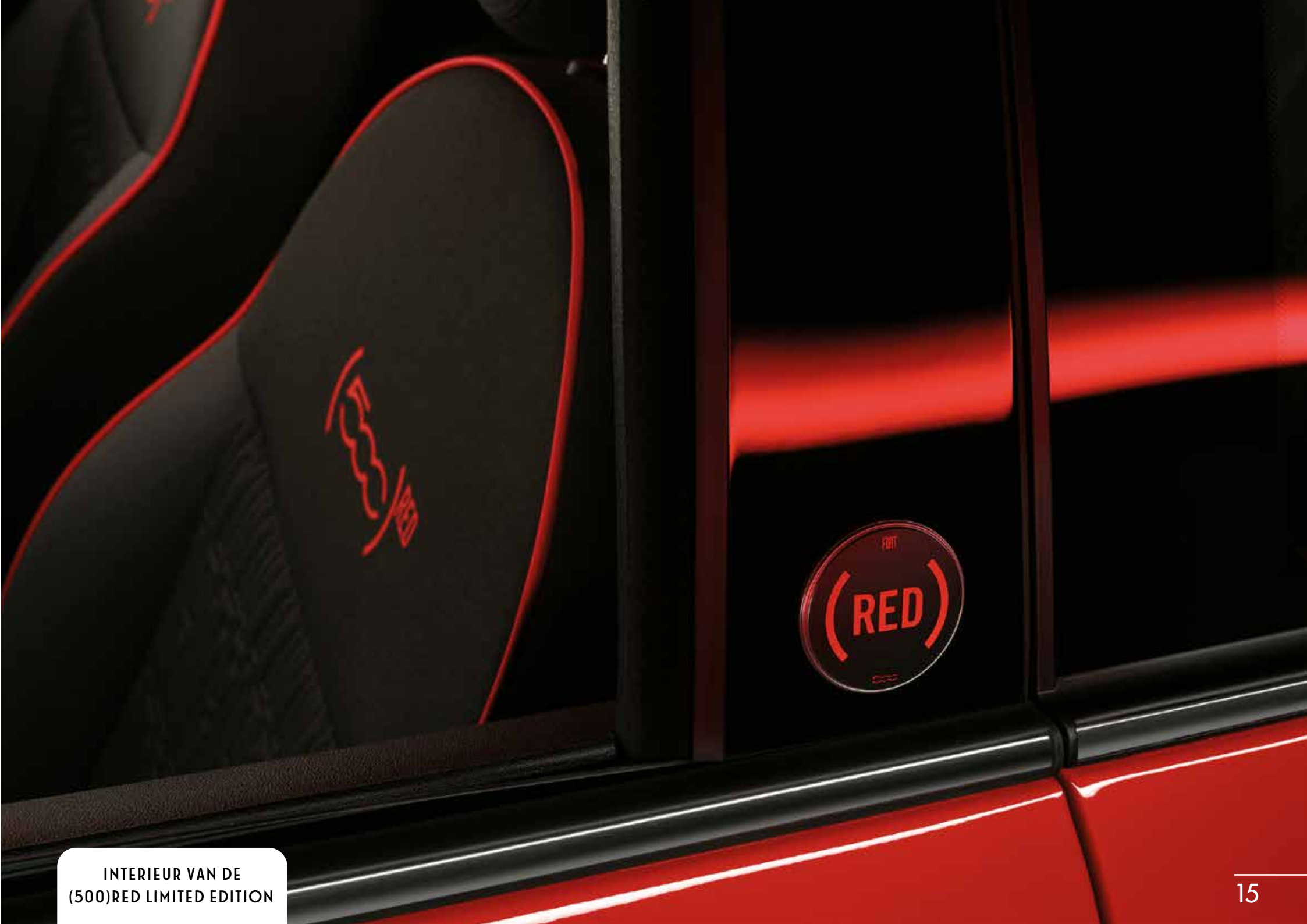
INTERIEUR VAN DE (500)RED LIMITED EDITION