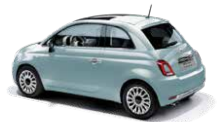
VERDE RUGIADA - 5CD/196