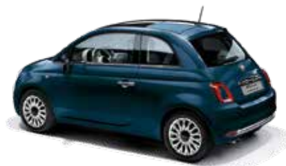
BLU DIPINTO DI BLU - 5DT/687