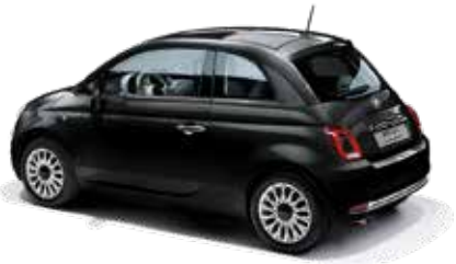
NERO VESUVIO - 5CE/876